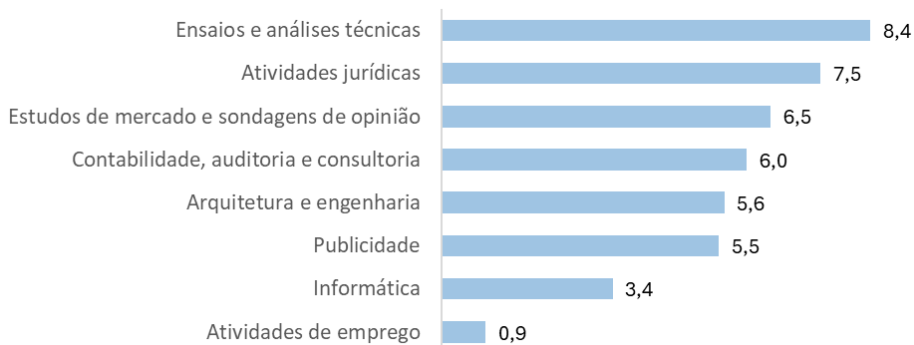
Figura III. Antiguidade média dos trabalhadores das sociedades dos SPE, por atividade