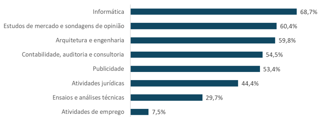
Figura IV. Proporção de trabalhadores com ensino superior nas sociedades dos SPE, por atividade