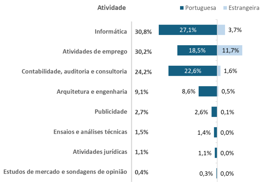
Figura II. Distribuição dos trabalhadores das sociedades dos SPE, por atividade e nacionalidade