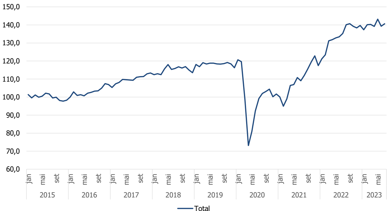
Gráfico 1. Índice de Volume de Negócios nos Serviços (2015=100)

Os índices de emprego, remunerações e horas trabalhadas ajustado de efeitos de calendário, apresentaram variações homólogas de 4,1%, 8,5% e 2,9%, respetivamente (em comparação com 3,8%, 12,3% e 5,9% em junho).