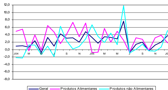
Vendas – Índice Geral e desagregações Variação homóloga, %

Em relação ao mês anterior, as vendas no comércio a retalho deflacionadas, corrigidas dos dias úteis e do efeito da sazonalidade, aumentaram 5,2%. Este comportamento foi determinado por variações de sinal contrário, de 11,3% no comércio de Produtos não alimentares e de -2,1% no comércio de Produtos alimentares .