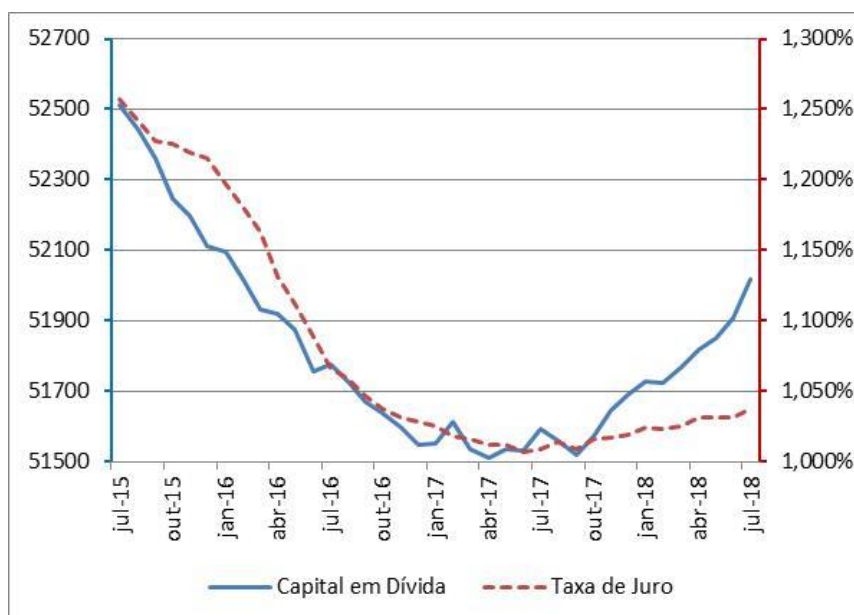
Gráfico 3: Capital Médio em Dívida (euros, escala da esquerda) e Taxas de Juro implícitas (% , escala da direita)

Os valores da Taxa de juro implícita, do Capital médio em dívida e da Prestação média vencida podem ser consultados na tabela em anexo.