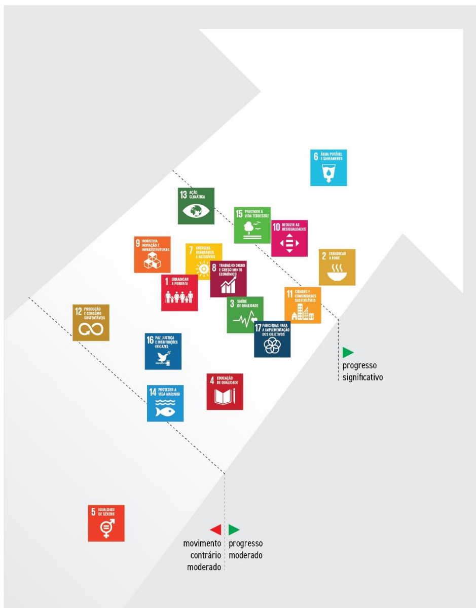
Figura 3. Posicionamento dos ODS em Portugal de acordo com a sua evolução no período 2015-2024

A partir da pontuação dos indicadores globais por ODS e por aplicação da metodologia do Eurostat foi possível apresentar o desempenho dos 17 ODS e proceder ao seu posicionamento conjunto de acordo com a sua evolução no período 2015-2024 (Figura 3).