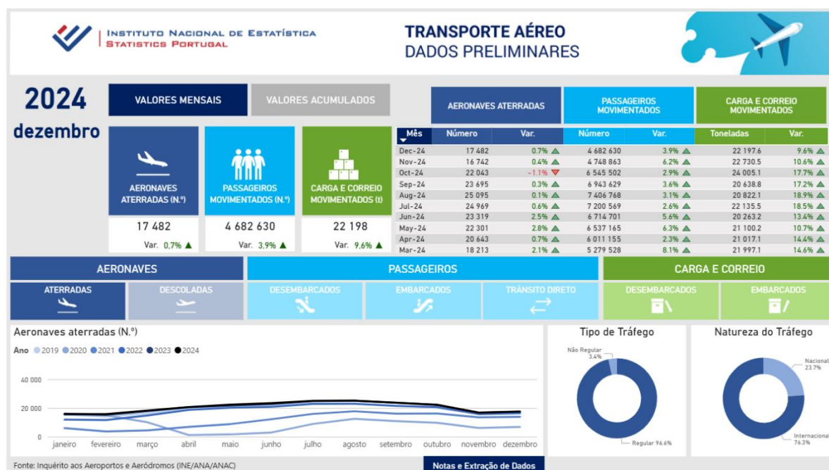
Figura 1. Panorama geral - Relatório interativo dos indicadores mensais