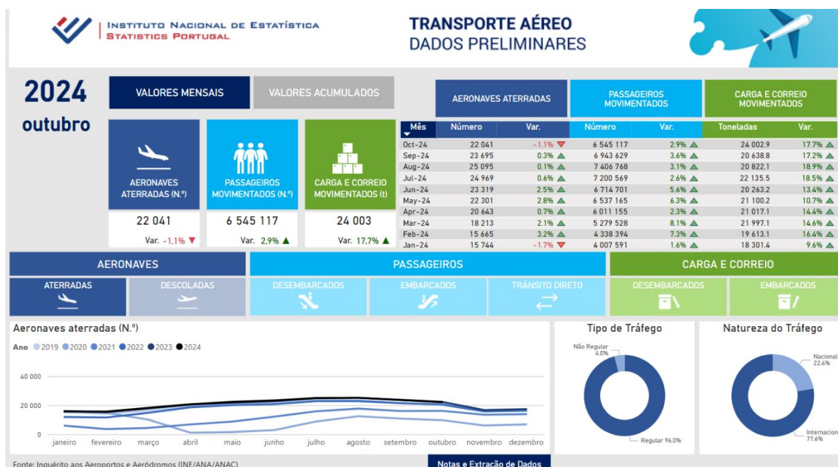
Figura 1. Panorama geral - Relatório interativo dos indicadores mensais